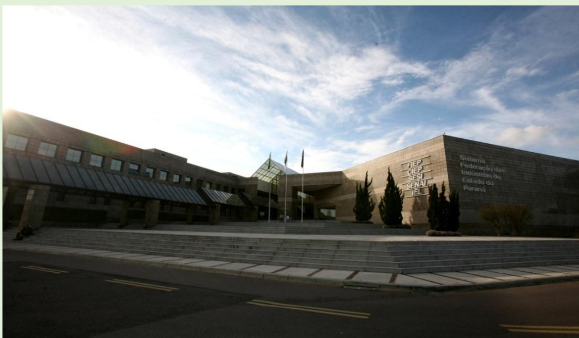
Campus da Indústria – Sistema FIEP

Na edição de 2018 o evento continua no CAMPUS DA INDÚSTRIA, em Curitiba totalmente revitalizado, para exposição de fornecedores do setor, palestras e desfiles. Estamos oferecendo uma excelente oportunidade para que sua empresa esteja demonstrando as novidades para os nossos empresários.